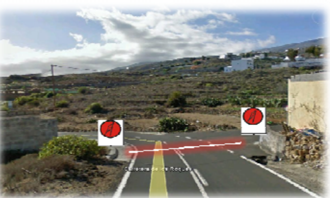
TC 3 y 6 FASNIA-ESCOBONAL 11,31 km Salida: TF-620 esq. casa antes calle a la Cooperativa