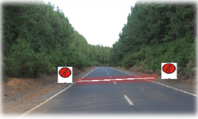
TC 1 y 4 LOS LOROS 13,00 km Salida:TF-523 En Recta P.K. 17,29 kms. (marca)