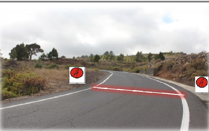
TC 9 FRONTON-GRANADILLA 17,68 km Salida: 20 m. antes muro contención