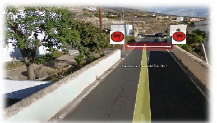
TC 3 y 6 FASNIA-ESCOBONAL 11,31 km Meta:TF-28 Puente antes cruce con TF-617 El Escobonal