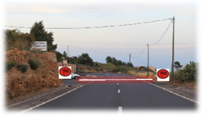
TC 1 y 4 LOS LOROS 13,00 km Meta:TF-523 entrada al Bar Borujo Bodega Comarcal