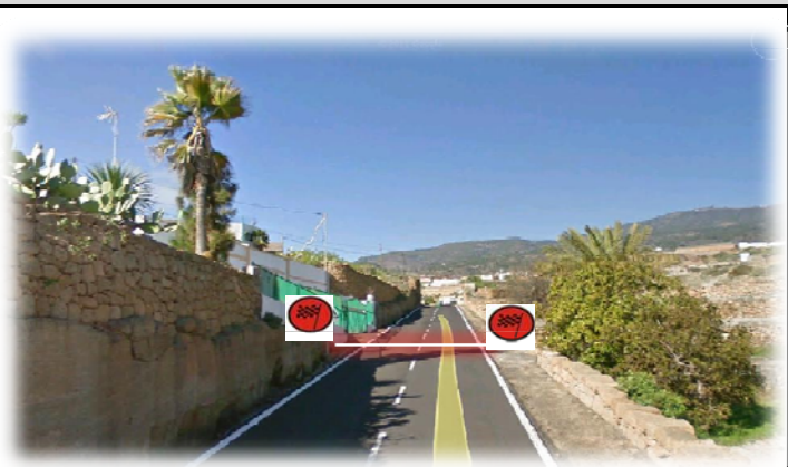
TC 8 EL RIO-LOS BLANQUITOS 5,44 km Meta: 90 m. antes km. 71 TF-28