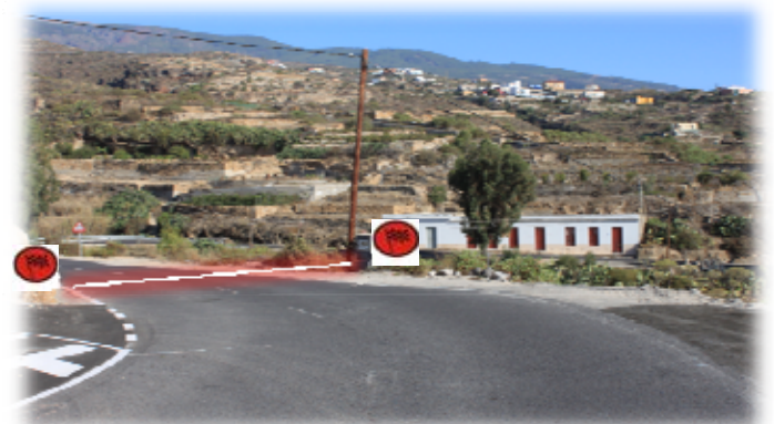
TC 2 y 5 ICOR 11,00 km Meta: TF-28 80 m. depsues P.K. 43 acceso asfalto izda.