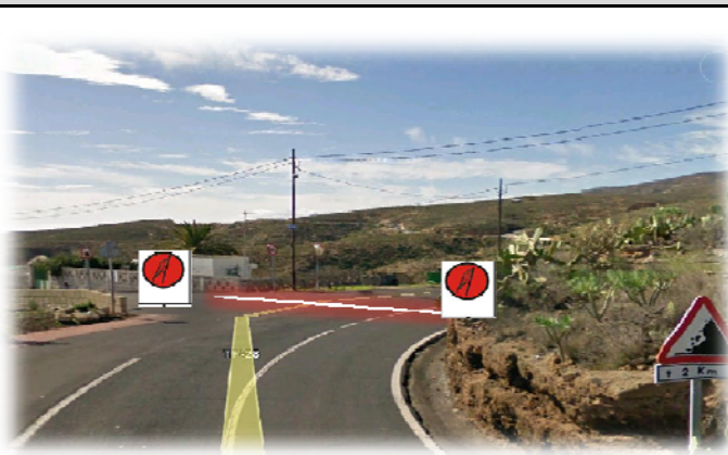
TC 8 EL RIO-LOS BLANQUITOS 5,44 km Salida: en stop al revés c/ El Pino