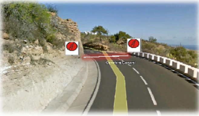
TC 2 y 5 ICOR 11,00 km Salida: TF-28 80 m. despues de P.K. 54 ultimo malecón