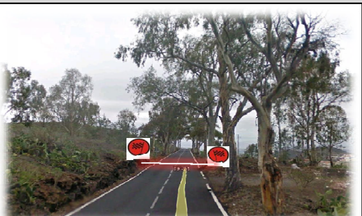
TC 9 FRONTON-GRANADILLA 17,68 km Meta: 130 m. después Señal Hito 81 entrada Tierra